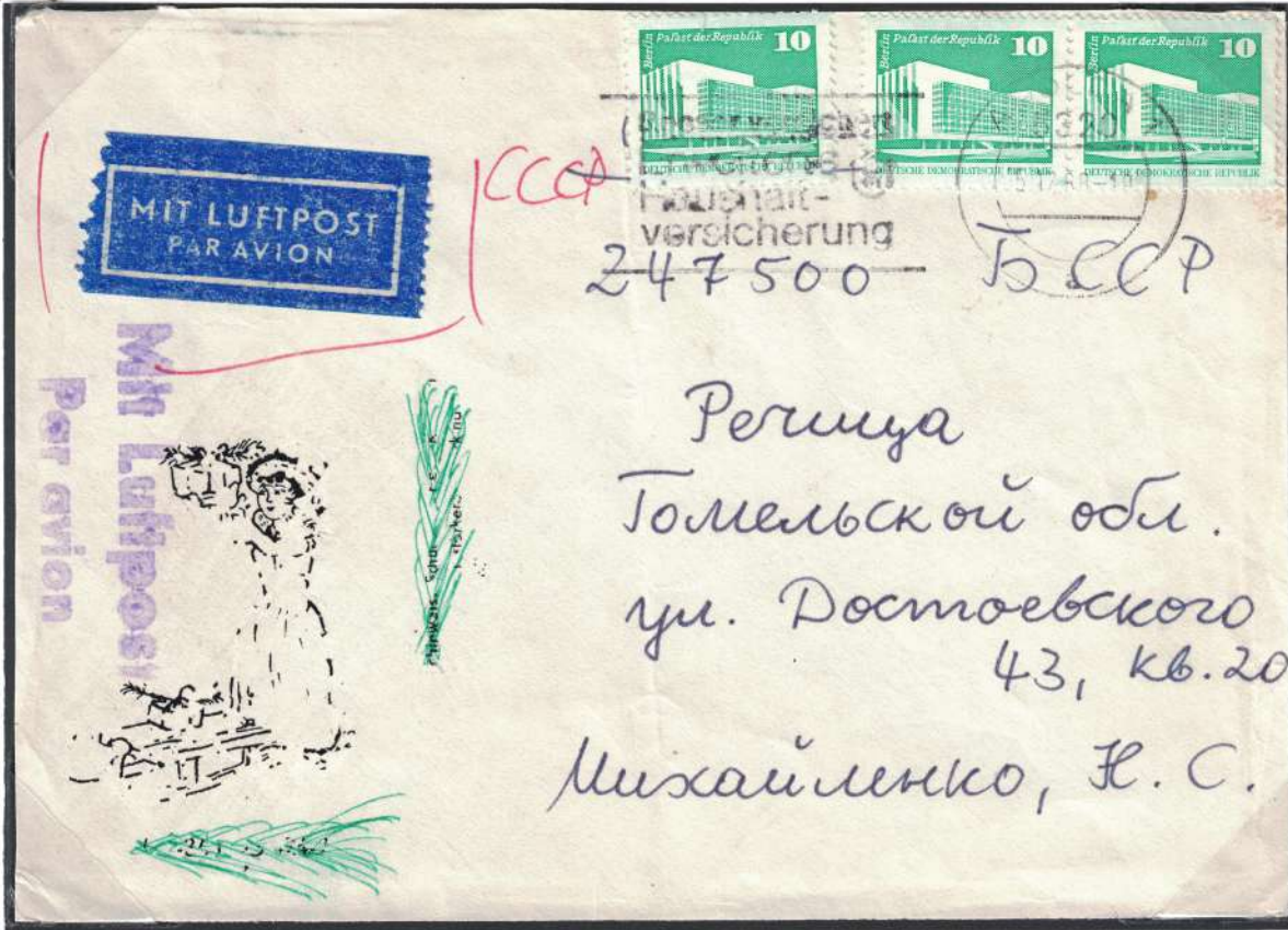
Авиаконверт из г. Берлин (05.12.1988) в г. Речица Белорусской ССР