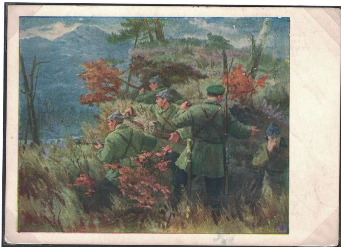
Почтовая карточка государственного издательства «Искусство» с изображением картины художника А. Бубнова «Пограничники»